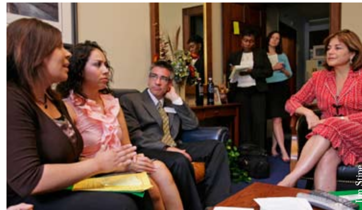
Jóvenes de Templo Calvario visitan en el día de cabildeo de Pan para el Mundo a la Rep. Loretta Sánchez (Demócrata Distrito 47, California).